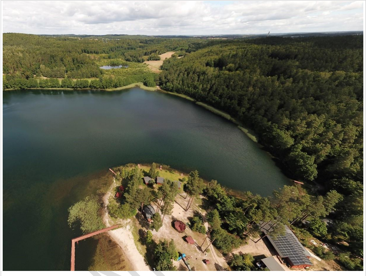
Fot. 3. Zagospodarowanie turystyczne ośrodka wczasowego nad jez. Czarne Dąbrówko

skala zagrożenia: zagrożenia potencjalne to zagrożenia mogące z dużym prawdopodobieństwem wystąpić na analizowanym obszarze (w granicach danego krajobrazu) do czasu następnego audytu krajobrazowego: 0 - brak zagrożeń; 1 - niewielkie; 2 - umiarkowane; 3 - duże; zagrożenia istniejące to zagrożenia występujące aktualnie: 4 - niewielkie, o słabnącym natężeniu; 5 - niewielkie, względnie stałe; 6 - niewielkie, o narastającym natężeniu; 7 - umiarkowane, o słabnącym natężeniu; 8 - umiarkowane, względnie stałe; 9 - umiarkowane, o narastającym natężeniu; 10 - duże, o słabnącym natężeniu; 11 - duże, względnie stałe; 12 - duże, o narastającym natężeniu.