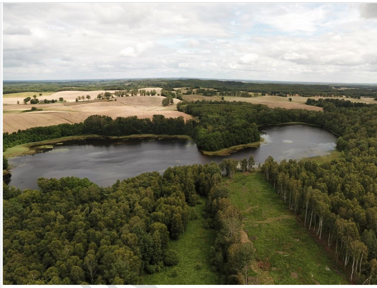
Fot. 1. Widok na jez. Łubienieckie wraz z siedliskami lasów bagiennych

Krajobraz priorytetowy lasy bytowskie rejon Łubieńca jest szczególnie cenny pod względem przyrodniczym ze względu na występowanie unikatowych w skali Polski jezior lobeliowych oraz znacznego udziału obszarów torfowiskowych o dużym znaczeniu dla retencji wody.