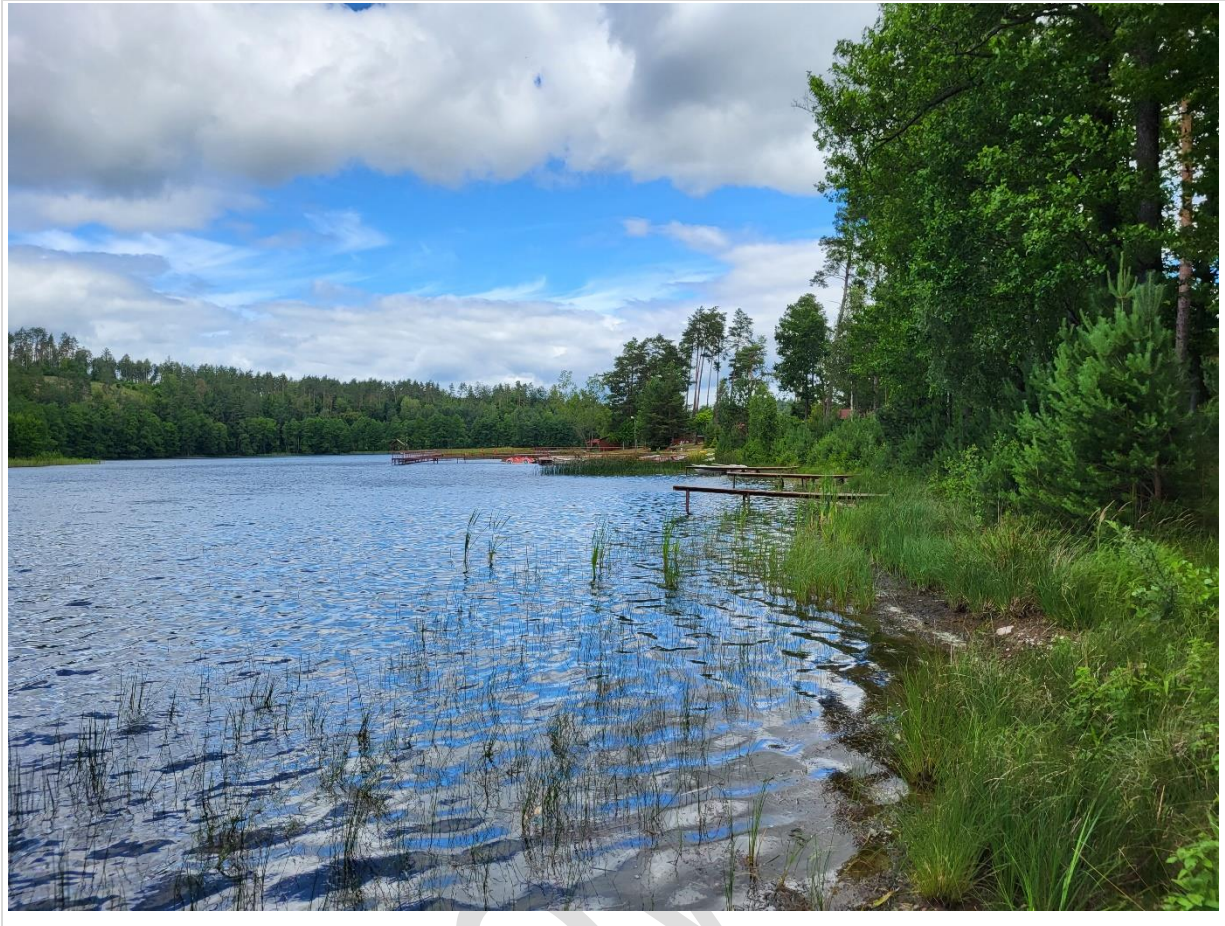
Fot. 2. Strefa litoralna jez. Czarne Dąbrówko